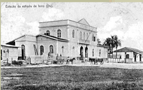
Estação da Estrada de Ferro Ytuana, construída em 1873. Foto c. 1910.