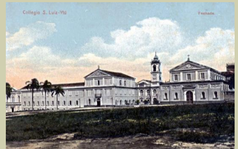
Fachada principal do Colégio São Luiz, inaugurado em 1867. Foto c. 1917.