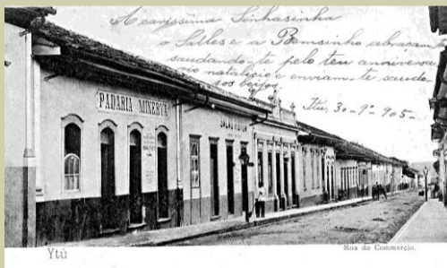
Rua Floriano Peixoto à época em que foi construída a casa sede do Museu da Música. Foto c. 1900.